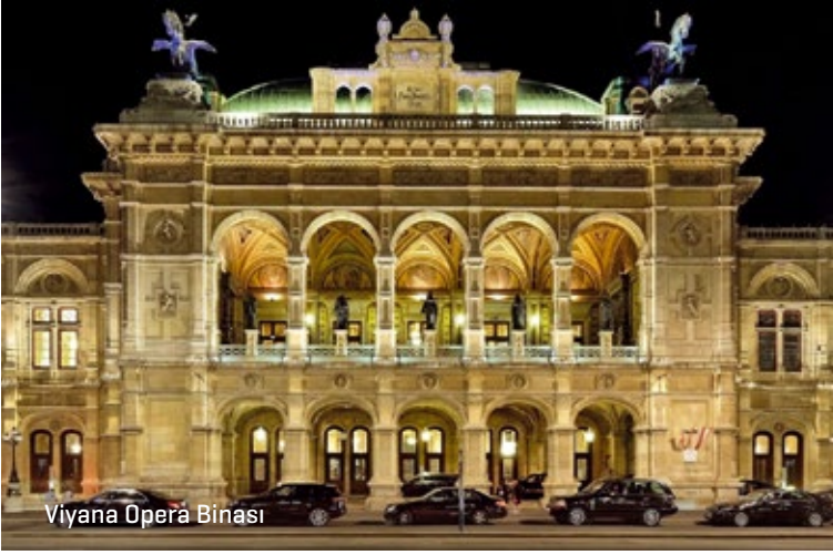
Viyana Opera Binası