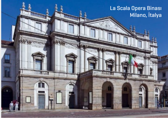
La Scala Opera Binası Milano, İtalya