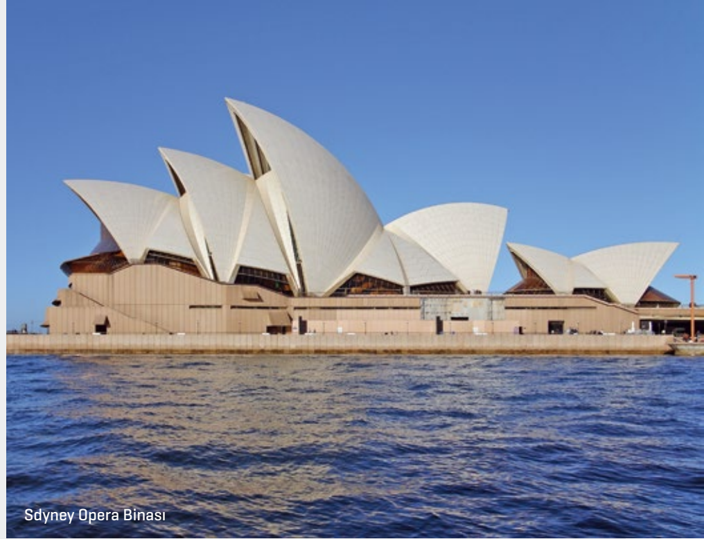
Sdyney Opera Binası

Kuşaklar arası bilgi aktarımının önemli bir bölümü sözlü olarak yapılmıştır. Akılda kalması kolay şiirsel anlatılar, müzikle beslenerek kuşaktan kuşağa aktarılır. Buna en güzel örneği yazının yaygınlaşmasından önce, yerel ozanlar tarafından bestelenen türküler gösterilebilir.