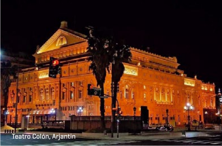
Teatro Colón, Arjantin