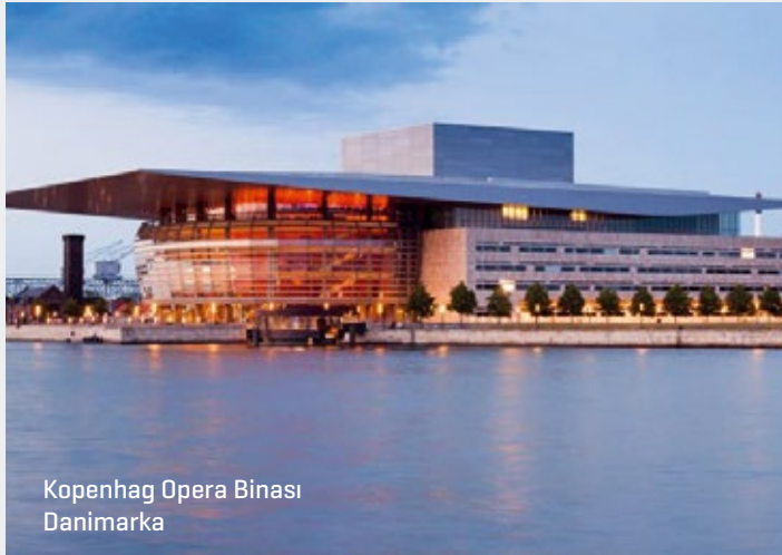
Kopenhag Opera Binası Danimarka