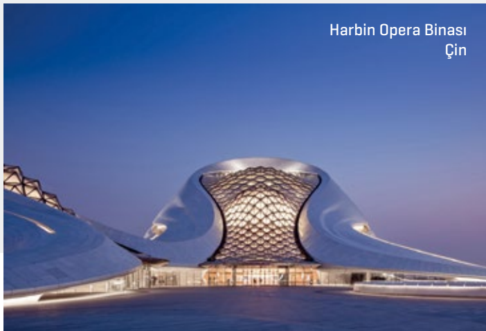
Harbin Opera Binası Çin

Guangzhou Opera House [Çin - Zaha Hadid], 2005 - 2010 yılları arasında inşa edilmiştir. İnci Irmağı'nın kıyıya vurduğu iki kaya parçasından ilham alınmış ve bina bu yüzden iki kayayı andıran, biri 1800 kişi kapasiteli oditoryumu, diğeri ise fuaye ve diğerk odaları barındıran iki binadan oluşuyor.