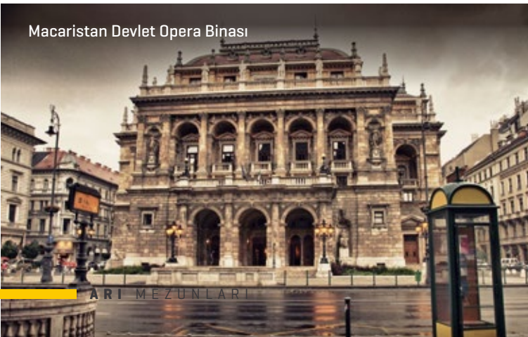
Macaristan Devlet Opera Binası

Öte yandan tarihte bölgeler üstü yönetimlerin meşruiyeti de sözlü müziklerle desteklenir. Tüm toplumu etkilemesi ve şekillendirmesi beklenen destanlar ya da dinsel ritüeller müzik yoluyla halka ulaştırılır. Sümerlerin Gilgamiş Destanı ya da Türklerin Dede Korkut Hikayeleri buna güzel örneklerdir. Konuyu biraz daha açmak gerekirse, Dede Korkut; destan, hikâye ve masal anlatımlarında yüceltilen, köklerini göçebe bozkır hayatının geleneklerinden alan ve hâlen yerleşik hayatın gündelik pratiklerinde kendine yer bulan; doğum, evlenme ve ölüm geleneklerine yansımış özlü sözleri, anlatımları, müzik aletleri ve ezgileri ile toplum hayatında önemli bir yeri olan yarı efsanevi bir bilgedir. Toplumsal kurallar müzikle birlikte toplum içinde dilden dile dolaşır. Organize dinler ve yönetimler geliştikçe yaygın müzik her dinin kendine has ilahileri ile ya da toplumsal marşlarla kendisini gösterir.